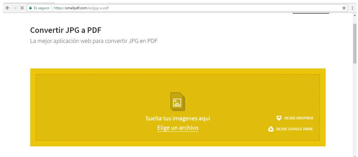
Figura 3: Pantalla del convertidor de imágenes al formato PDF

Se despliega la pantalla del convertidor. Proceder a hacer clic en donde dice “Elige un archivo”