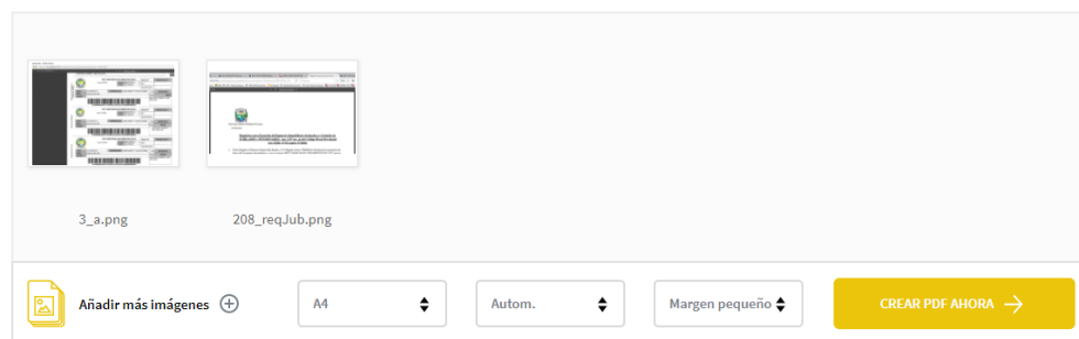
Figura 4: Pantalla con imágenes seleccionadas desde la Computadora

La mejor aplicación web para convertir JPG en PDF