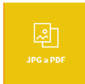
Figura 2: Botón de acceso a la herramienta

El contribuyente debe ingresar a la funcionalidad haciendo clic en el botón JPG to PDF